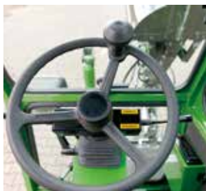
Lenkstockscharter, einstellbare Lenksäule