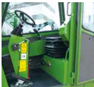
Bequemer Einstieg, kippbare Armlehne